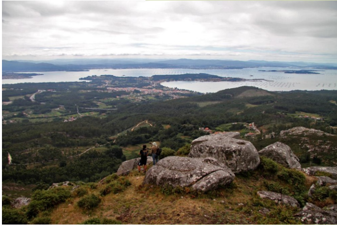
Cume do Castelo de Vítres e Ría de Arousa