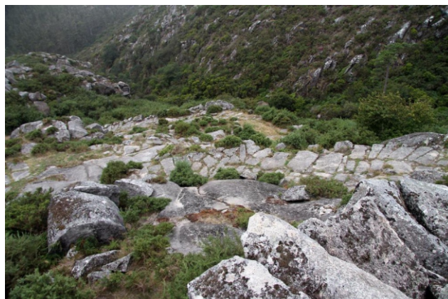
Calzada de acceso ao castelo