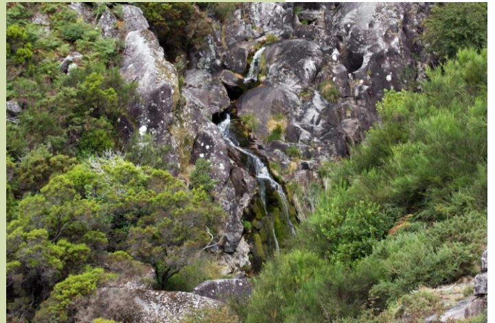
Fervenza no río Lérez