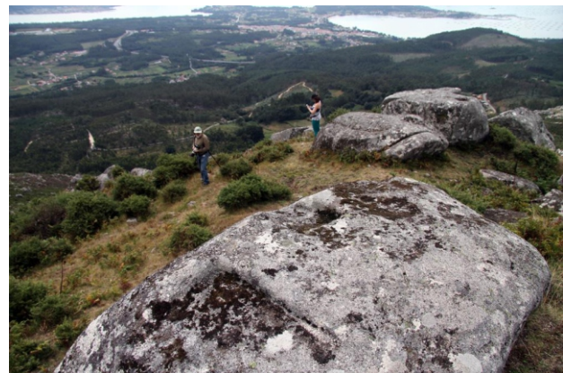
O Castelo de Vitres, o asentamento dun castelo medieval desaparecido hai moitos anos