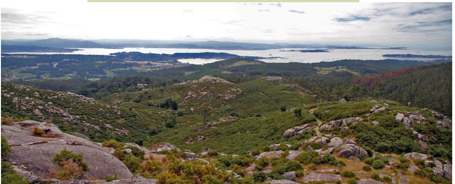
Panorámica da Ría de Arousa desde o Castelo de Vítres