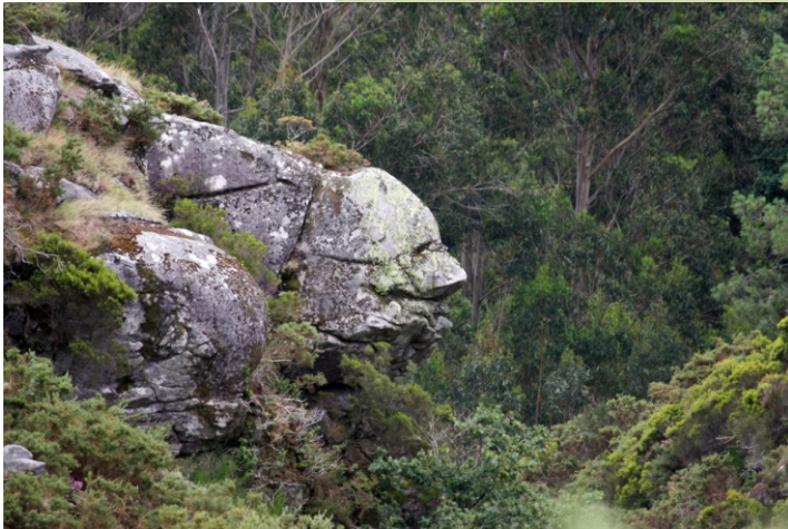
Unha rocha no val do Lérez